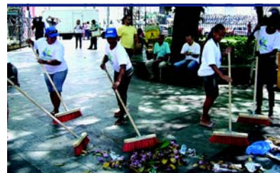
Praça da Piedade – Centro Histórico de Salvador/BA