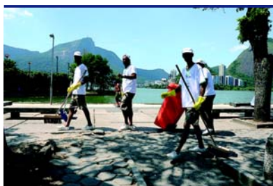
Lagoa Rodrigo de Freitas – Rio de Janeiro/RJ