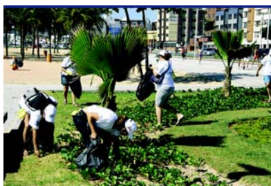
Praia de Camburi – Vitória/ES