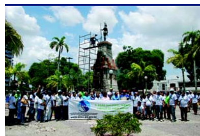
Praça Brasil – Belém/PA