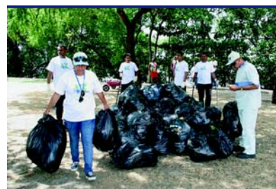
Rio das Bicas – São Luís/MA