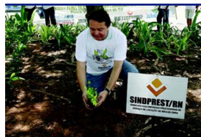
Parque das Dunas – Natal/RN