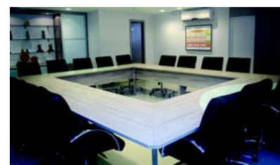
Sala de Reunião