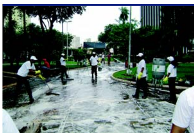
Praça Ary Coelho – Campo Grande/MS