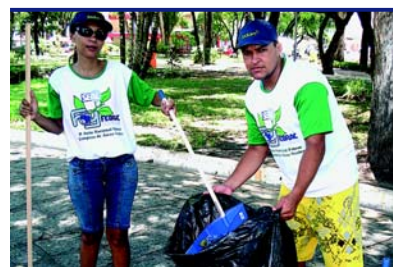
Praça Olimpio Campos – Aracaju/SE