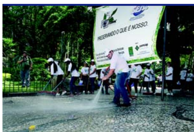
Praça XV de Novembro – Florianópolis/SC