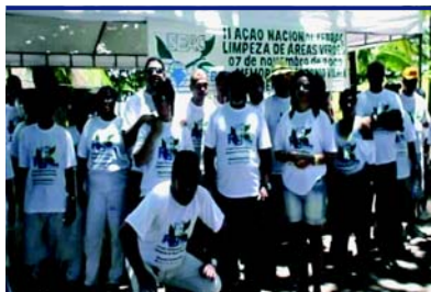
Memorial Teotônio Vilela – Maceió/AL

Voluntários .... 2.093 mil pessoas Total de lixo recolhido ..... 40.710 toneladas Quantidade de Mudas doadas ..... 2.255 plantas Quantidade de Folders ..... 9.000 Sacos de lixo ecológicos para carro ..... 1.000